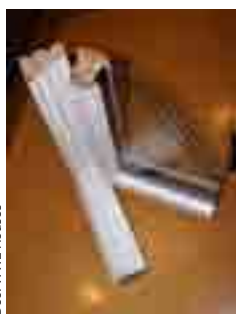
Doc. WWL Houses

VICAT - 4 rue Aristide Bergès 38080 L'Isle d'Abeau - 04 74 18 40 06 - f.soudan@vicat.fr