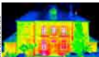
Doc. SEINE ENERGIE

ROQUETTE - Rue de la Haute Loge - 62136 Lestrem - 03 21 63 36 00 - gaialene@roquette.com