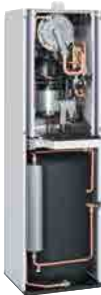
Vitotwin 350-F ▶

■ La chaudière murale à micro-cogénération Vitotwin 300-W , affichant des dimensions compactes, utilise une technologie éprouvée assurant la production simultanée d'électricité et de chaleur dans les maisons individuelles. Cette chaudière murale à micro-cogénération avec moteur Stirling couvre les besoins calorifiques du bâtiment (jusqu'à 20 kW thermiques) et convient idéalement pour la couverture des besoins électriques de base (1 kW électrique). La Vitotwin 300-W et sa version avec ballon tampon intégré de 175 litres Vitotwin 350-F sont en cours d'expérimentation sur différents marchés européens, la commercialisation en France est attendue pour 2014.