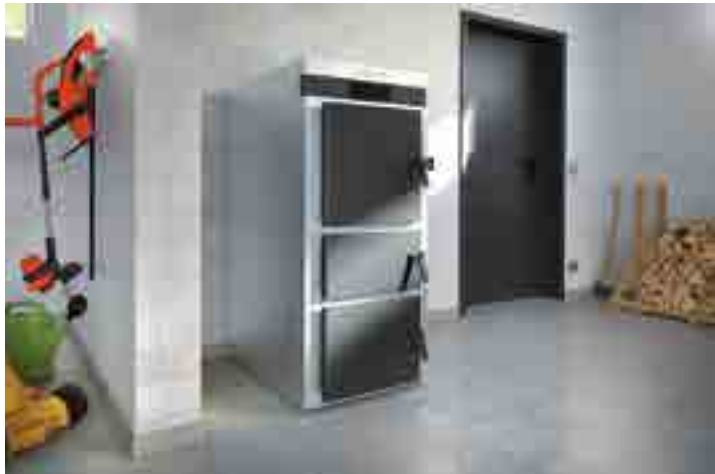
La nouvelle chaudière bois à bûches Vitoligno 200-S