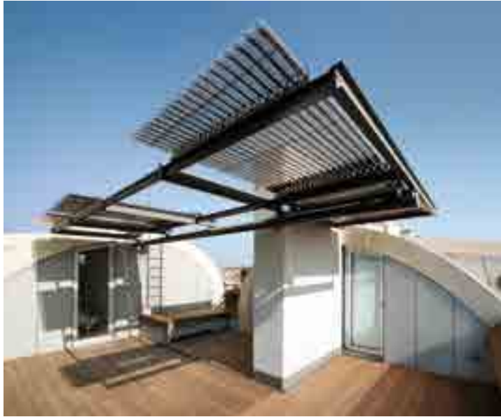
Les nouveaux capteurs solaires à tubes sous vide Vitosol 200-T peuvent être montés dans toutes les positions : verticalement ou horizontalement sur des toitures à pans, en façade ou balustrade de balcon, et même à plat sur un toit-terrasse.

■ De nouveaux modèles de capteurs solaires feront par ailleurs leur apparition à la rentrée : les nouveaux Vitosol 200-T SPE (1,63 à 3,26 m 2 ) et SP2A (1,25 à 3 m 2 ) à tubes sous vide peuvent être montés dans toutes les situations : verticalement ou horizontalement sur des toitures à pans, en façade ou balustrade de balcon, et même à plat sur un toit-terrasse.