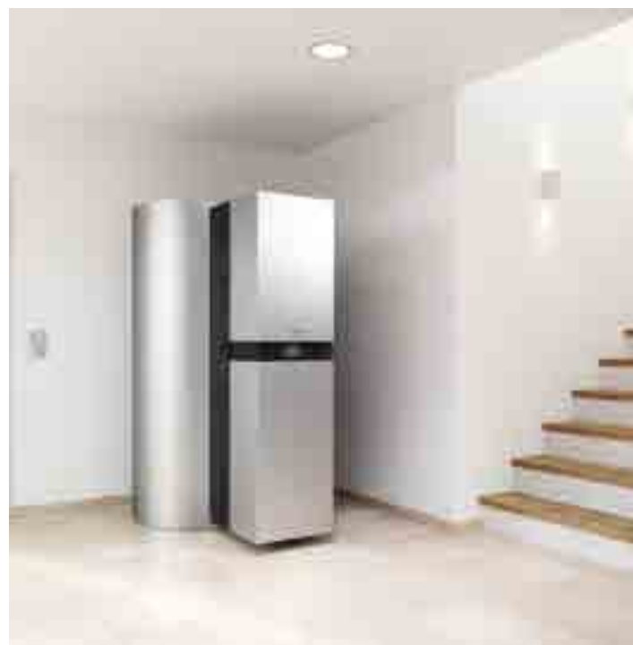
▲ Vitosolar 300-F : la combinaison gagnante qui conjugue chaudière à condensation et solaire, une solution qui rentre à elle seule dans le cadre du bouquet de travaux (chauffage et eau chaude solaire) et permet d'accéder à des taux majorés, de 18 % pour la chaudière et de 40 % pour les matériels solaires.

Certificats d'économies d'énergie (CEE) : ce dispositif oblige les fournisseurs d'énergie (électricité, gaz, chaleur, froid et fioul domestique) et de carburant à réaliser des économies d'énergie auprès de leurs clients. Ces « obligés » peuvent proposer un accompagnement aux particuliers dans la réalisation de travaux de rénovation énergétique ; en contrepartie, ils récupèrent des CEE. Les travaux éligibles concernent l'isolation (murs, toiture, combles, sols), le changement de fenêtres, le chauffage et l'eau chaude (chaudière, pompe à chaleur, énergies renouvelables, régulation), la ventilation... Le particulier obtient un diagnostic, un prêt à taux bonifié ou encore une remise sur la facture d'énergie ou une prime dont le montant est proportionnel à l'économie d'énergie réalisée, et, en général, à la facture.